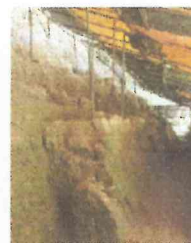
FOTOS. EMMR. 2015. ESTRUCTURA 5D-15. DE ISQUIERDA A DERECHA. PROCESO DE EXCAVACIÓN ARQUEOLÓGICA EN ESQUINA NORESTE Y EN EL LADO NORTE, PRIMERO Y SEGUNDO BASAMENTO.