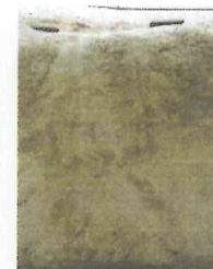
FOTOS. EMMR. 2015. DE ISQUIERDA A DERECHA, ESTELA 22 DEL COMPLEJO "Q" Y PETROGRABADO DE CALZADA MALER, ANTES Y DEPUES DEL APLICADO DE LEJÍA DE AGUA DE CAL.