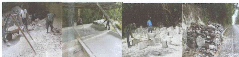
FOTOS. EMMR. 2015. ISQUIERDA A DERECHA, FIGURA QUE ESTBLECE LA EXTRACCIÓN Y COLADO DE TIERRA BLANCA. FIGURA QUE DETALLA EL FRAGUADO DE CAL EN PILETAS. FIGURA QUE DEMUESTRA LOS BLOQUES LABRADOS EXTRAIDOS Y ACARREADOS DE CANTERA. FIGURA QUE DENOTA LAS PIEDRAS TIPO LAJA.